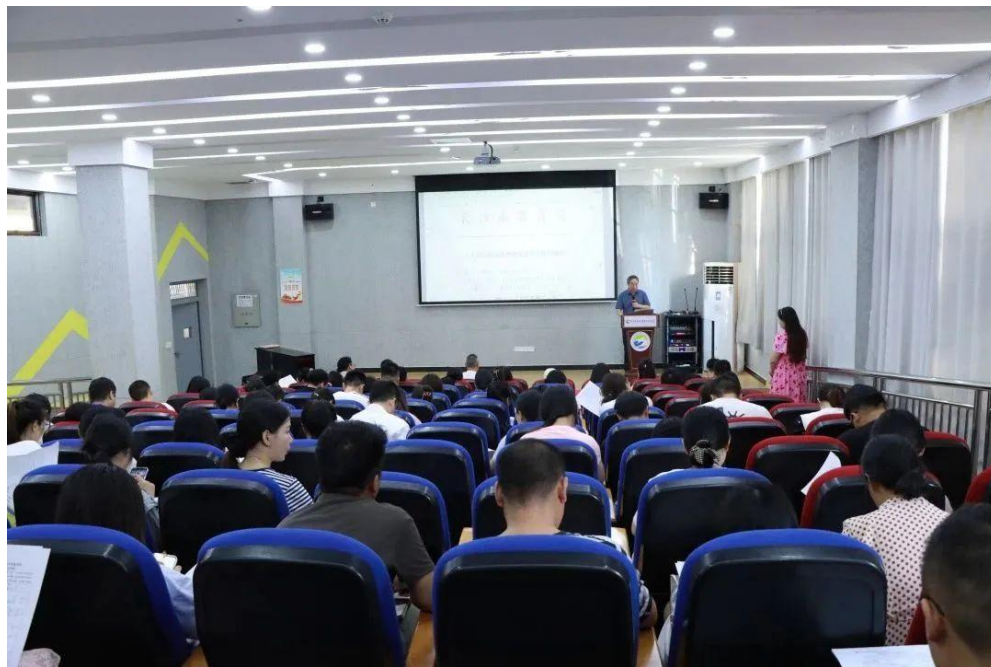
图 64 组织全体教师集中学习职业教育政策及《职业教育法》

党和国家高度重视职业教育发展，特别是党的十九大以来，党中央、国务院连续发文，高位部署职业教育改革工作。2019 年，国务院印发《国家职业教育改革实施方案》；2021 年，中办、国办印发《关于推动现代职业教育高质量发展的意见》；2022 年，实施新修订的《中华人民共和国职业教育法》，中办、国办印发《关于加强新时代高技能人才队伍建设的意见》《关于深化现代职业教育体系建设改革的意见》。在这些国家顶层设计和重大部署中，优化职业教育类型定位、构建高质量现代职业教育体系、增强职业教育适应性和吸引力是反复强调和持续深化的重点任务，也是未来仍需持续发力的改革方向。