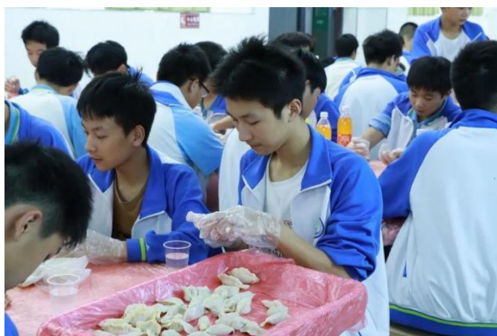
图 53 立冬包饺子活动

中华优秀传统文化是中华民族的文化根脉，近年来，学校对优秀传统文化的重视与日俱增。学校充分利用传统节日契机，对学生进行传统文化教育，旨在传承中华优秀传统文化，增强学生民族自豪感。在重阳节，学校组织学生前往敬老院为老人们进行文艺汇演，使尊老、爱老、敬老的良好风尚和优良传统永远传承；在立冬时节，为传承中华传统习俗，由学工处主办的“立冬包饺子活动”在学校食堂温情举行；在劳动节，学校组织学生开展劳动教育，对学校周边街道进行清扫服务；在教师节，学校认真准备、精心策划了一场大型文艺汇演。学校根据学生的特点，举行形式多样的传统文化教育活动，以引导学生认知传统、尊重传统、弘扬传统，进一步了解、认同、喜爱传统节日，增强爱国情感。