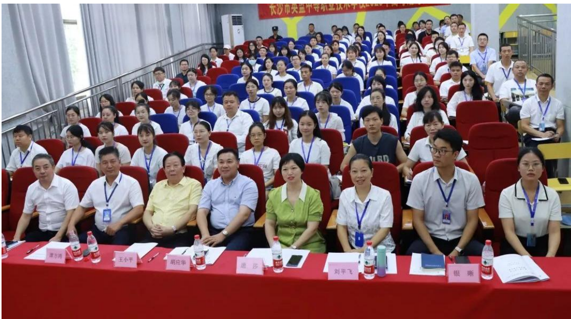
图 23 秋季校本培训

请专家进校开设了专题讲座，并参加了各种方式的教学研究活动，使教师开阔眼界，拓展思路。