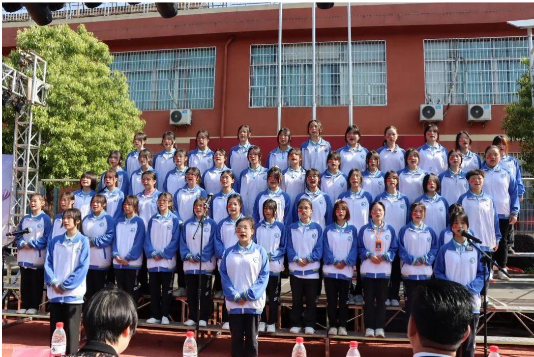
图 63 中华经典朗诵比赛