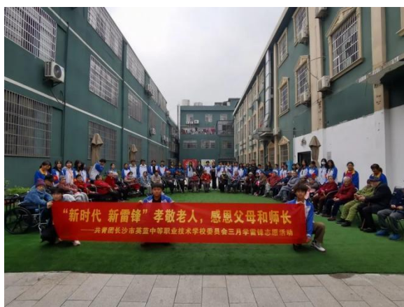
图9 敬老爱老志愿服务活动