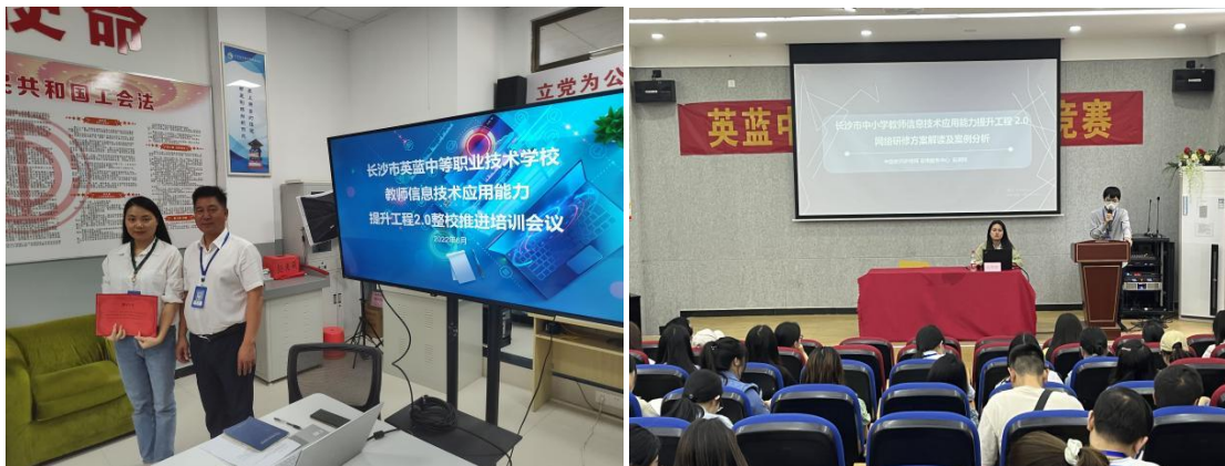
图 34-35 教师信息技术应用能力提升工程 2.0 培训会

上。经过一系列举措，我校以 90 分以上的高分通过长沙市中小学（幼儿园）教师信息技术应用能力提升工程 2.0 整校推进评估验收，李亮奇获得长沙市中小学（幼儿园）教师信息技术应用能力提升工程 2.0 优秀管理员。