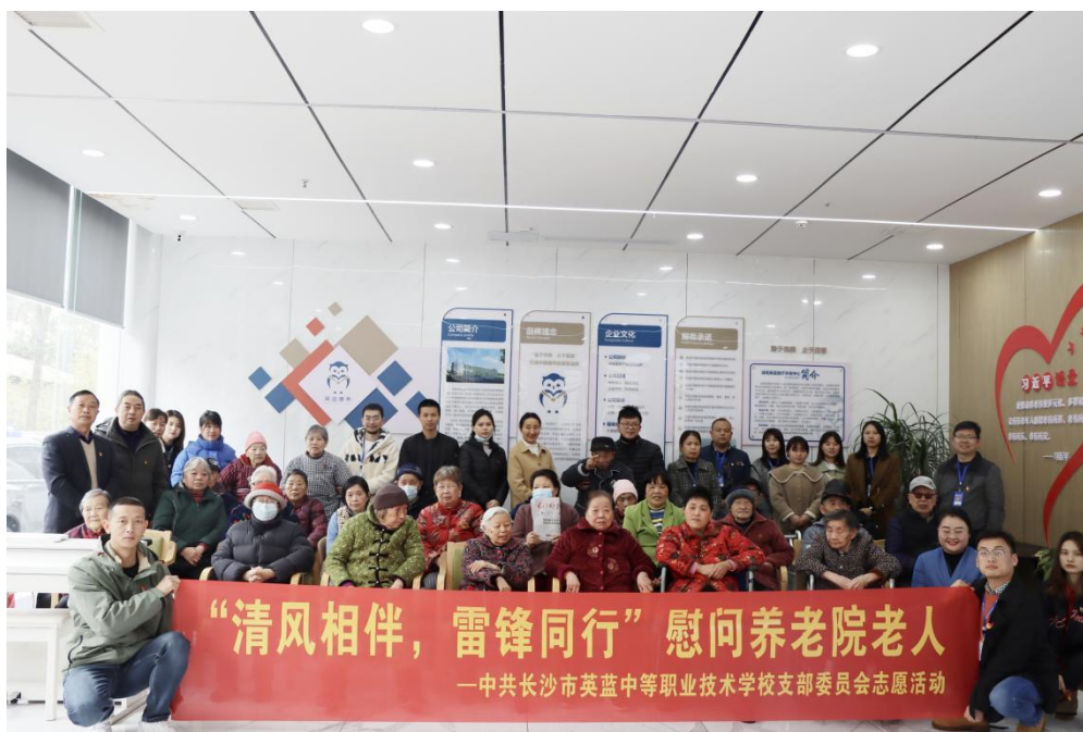
图1 学校党支部开展慰问养老院老人志愿活动

是党员向我看、立足岗位作贡献”活动。学校全体党员戴好党徽亮身份，服务社会帮助群众走在前。党员带领团员和师生先后开展了“清风相伴，雷锋同行——慰问养老院老人志愿活动”、“传承红色基因，做合格党员——湖南烈士塔前重温入党誓词，缅怀革命先烈”活动、“党员团员齐动手，义务劳动展风采——美化校园环境，洁净工作生活场所”活动、“我为学校献一策——为学校排忧解难”活动、“视学生如家人，助学生健康成长——党员联系“四特”学生”活动、“调查研究到一线，解决问题在现场——党员干部联系班级活动”、“党员和团员志愿者到社区参加志愿服务”等各种活动，彰显了党支部战斗堡垒作用和党员先锋模范作用。