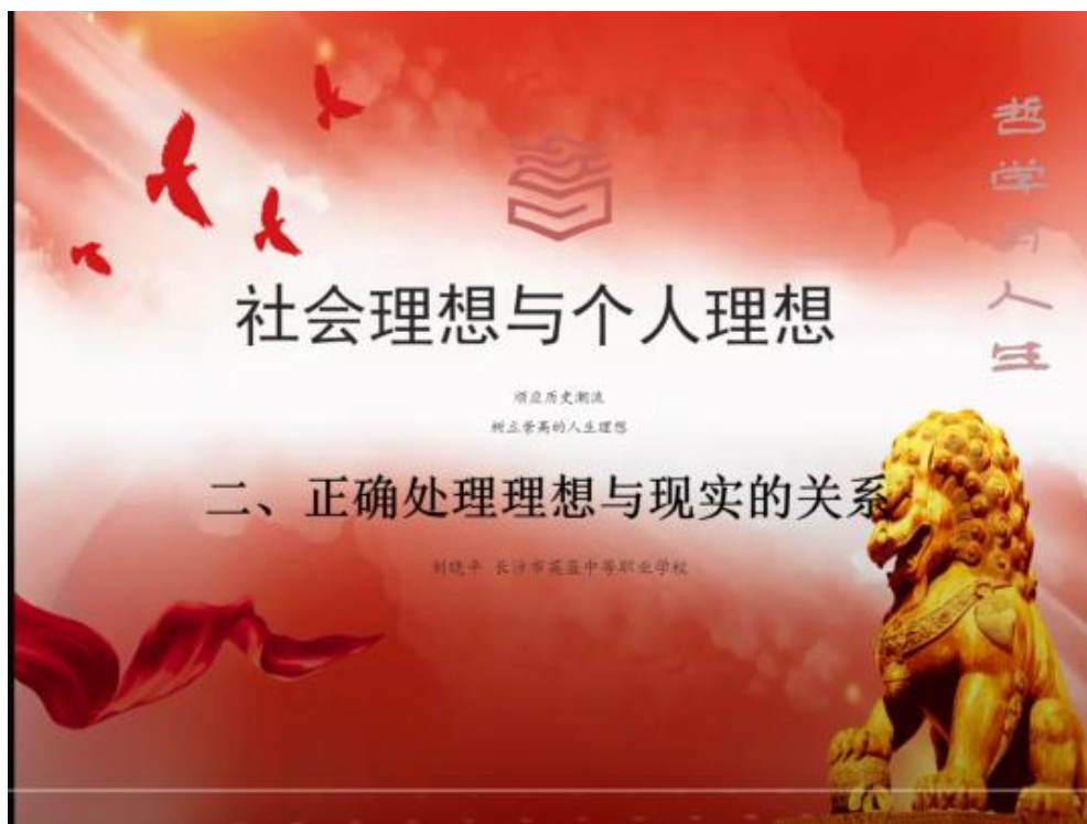
图 40 组织“二十大精神进课堂”教师课程思政微课竞赛