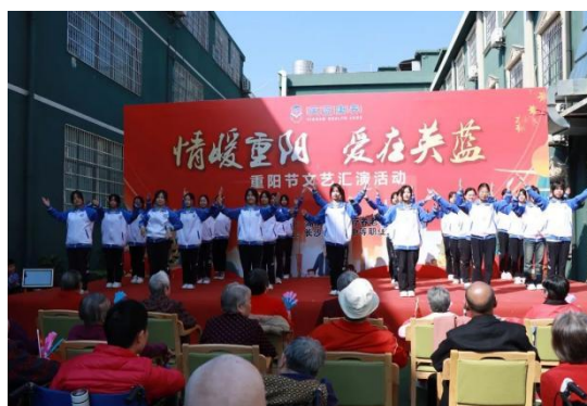
图 54 重阳节文艺汇演