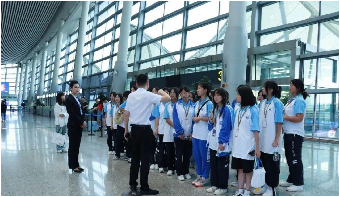
图 31 城市轨道交通运用服务专业学生前往黄花机场观摩学习