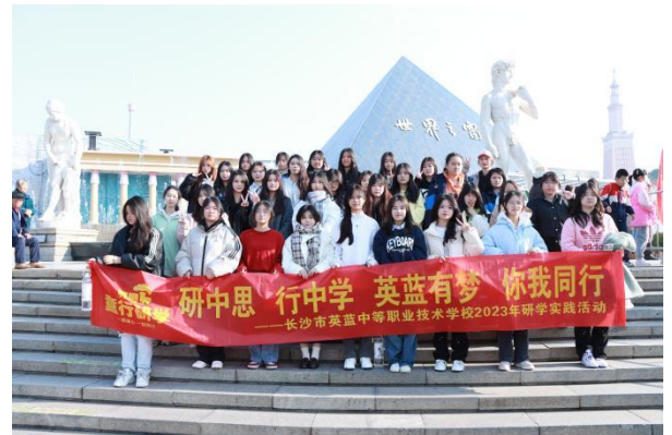
图 16 世界之窗研学活动