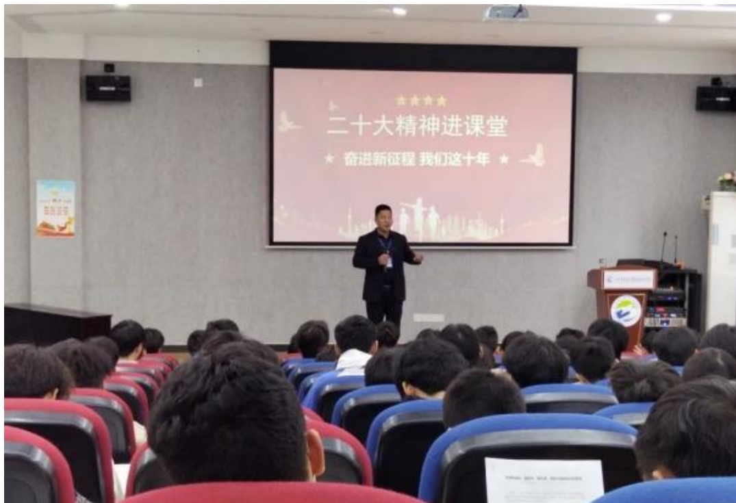
图 38 举行“校长讲二十大专题思政课”讲座