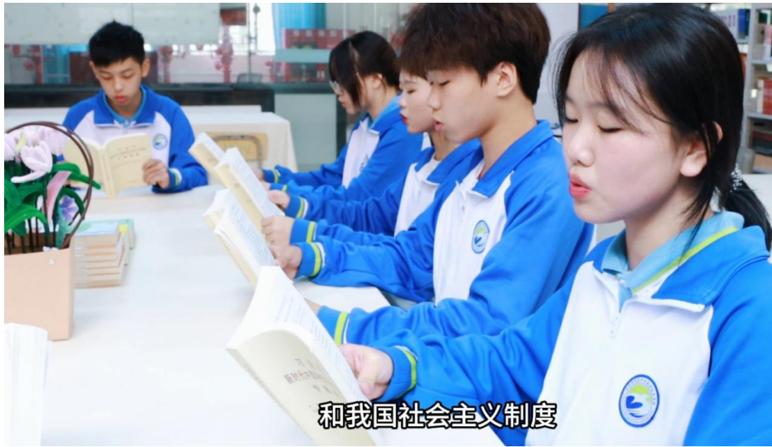
图 37 开展“悦读伴我成长”职教学生读党报活动