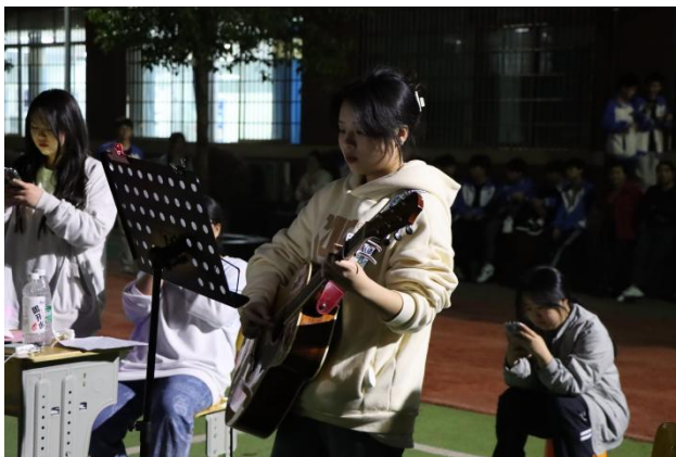
图 17 草坪音乐节