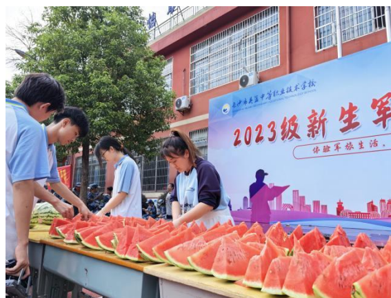
图 20 吃西瓜比赛