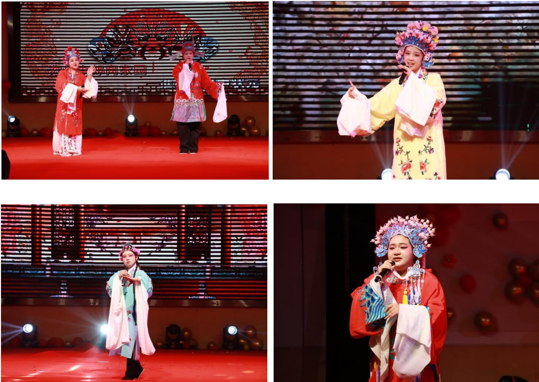
图 54-图 57 戏曲表演

学校广泛开展民族传统技艺传承活动，涉及民族舞蹈、民族歌曲、剪纸、戏曲、国画、武术等，以确保学生在在校期间接受到民族技艺传承的教育，体验到传统技艺的韵味与独特魅力，增强文化素养，弘扬与传承中华优秀传统文化。