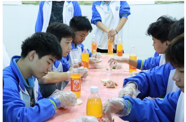
图 14 冬至包饺子活动