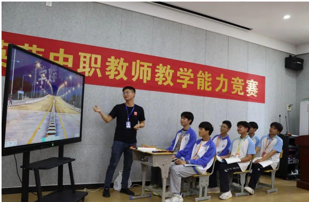
图 24 教师教学能力竞赛