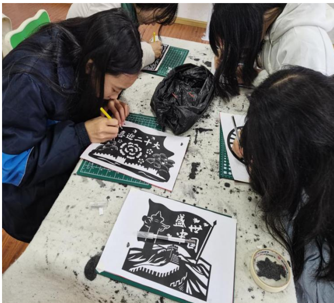
图 43 举行“学习二十大，奋进新征程”艺术绘画、书法、摄影大赛