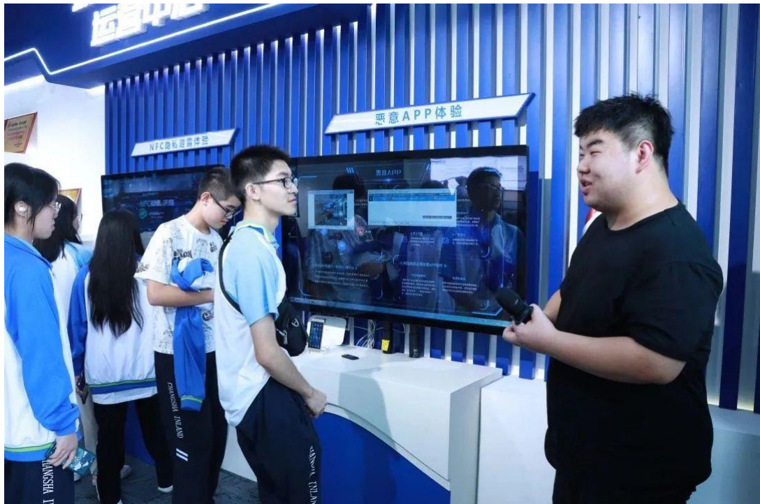
图 32 计算机应用专业学生前往奇安信科技集团股份有限公司参观