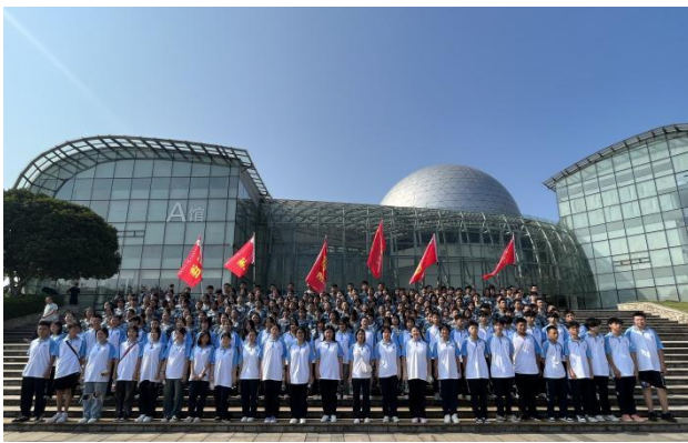
图 15 赴湖南科技馆参观学习