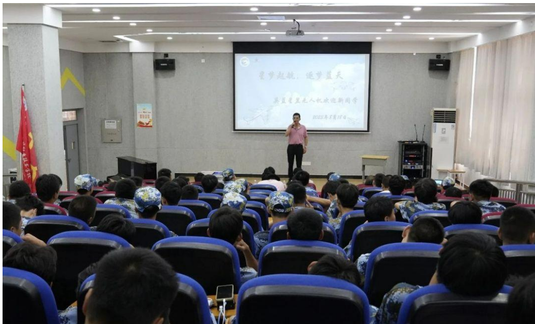
图 26 无人机操控与维护专业知识讲座