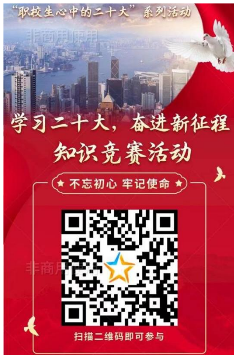
图 44 举行“学习二十大，奋进新征程”线上知识答题活动