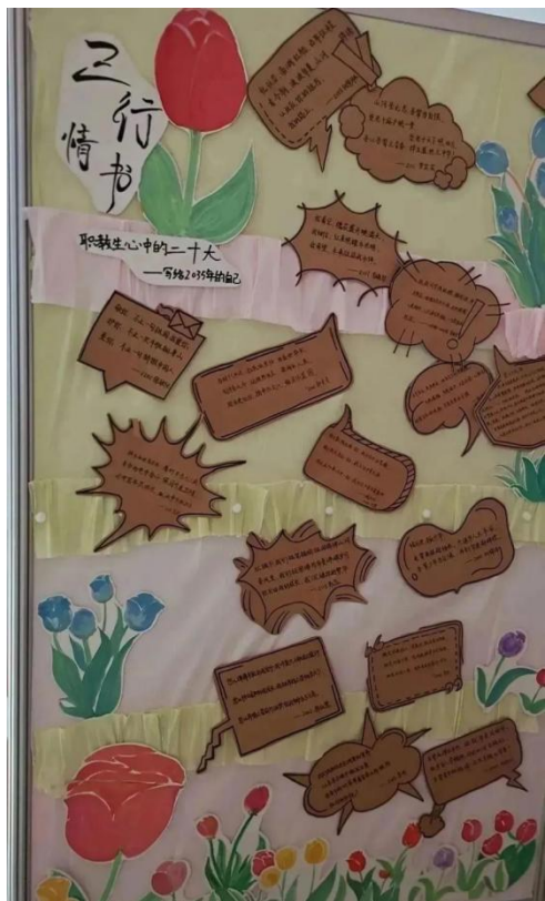
图 41 举行“职教生心中的二十大 写给 2035 年的自己”三行情书赛