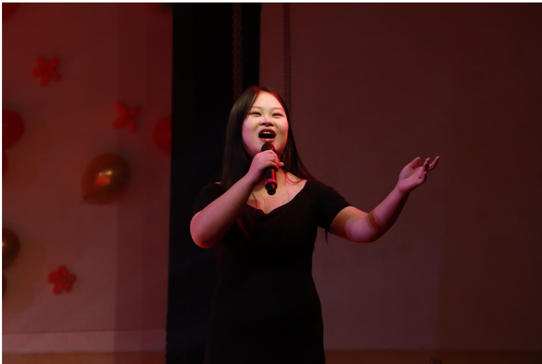
图 45 举行“建团百年，学习二十大，欢歌赞中华”歌唱祖国歌曲比赛暨第四届校园歌手大赛

“职教生心中的二十大”系列活动的开展助力我校切实把党的二十大精神的思想精髓和核心意义更好地贯彻，更好地引导全校师生衷心拥护党的领导。同时我校还将系列活动成果进行了“职教生心中的二十大”文艺作品展演。展演展出的作品丰富多彩，有油画、剪纸、水彩画、素描、编织、黏土等多种形式。学生们用自己创作的绘画和手工作品，歌颂了党的二十大，掀起了全校宣传贯彻党的二十大精神热潮，使职教学子们充分认识党的二十大重大意义，准确领会把握党的二十大精神的思想精髓和核心要义，推动习近平新时代中国特色社会主义思想和党的二十大精神入脑入心。将党的二十大精神融入立德树人全过程，坚持德技并修，教育引导学子衷心拥护党的领导和我国社会主义制度，把小我融入大我、融入中华民族伟大复兴。