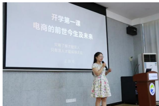
图 30 电子商务专业知识讲座