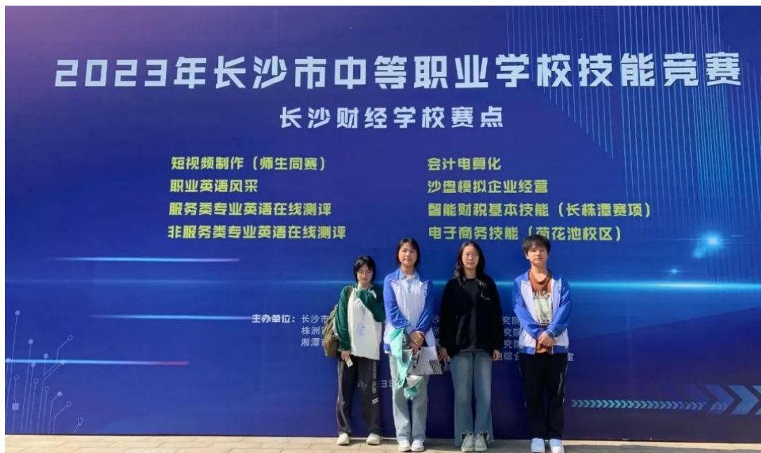
图 22 长沙市中职学校英语技能竞赛在线测评赛项