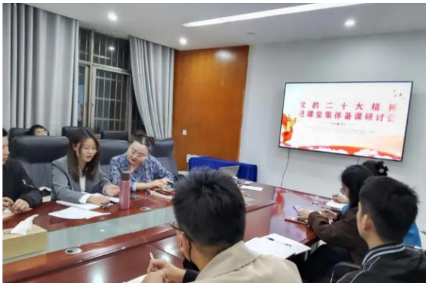
图 36 举行党的二十大精神进课堂集体备课研讨会

为推动党的二十大精神深入人心、落地生根，全面提高职业教育人才培养质量，帮助我校青年学生坚定理想信念、树立远大理想。我校于2022年11月至2023年6月持续开展了“职教生心中的二十大”系列活动，深入学习领会、大力宣传党的二十大精神，将其作为当前和今后一个时期学生教育的首要政治任务。为此，我校出台了开展“职教生心中的二十大”系列活动方案，围绕“融入课堂教学”、“书记校长讲专题思政课”、“开展“职教生心中的二十大”主题团日和班会活动”、“组织收看“同上一堂思政大课——职教生心中的二十大”活动”等方面各策划开展十项活动。