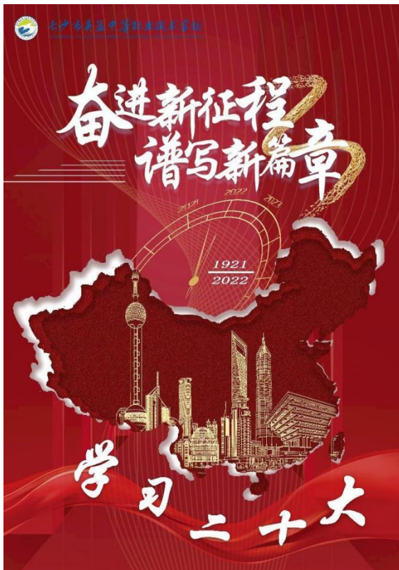
图 42 举行“学习二十大，奋进新征程”电子海报设计大赛