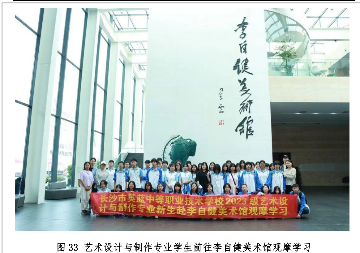
图 33 艺术设计与制作专业学生前往李自健美术馆观摩学习