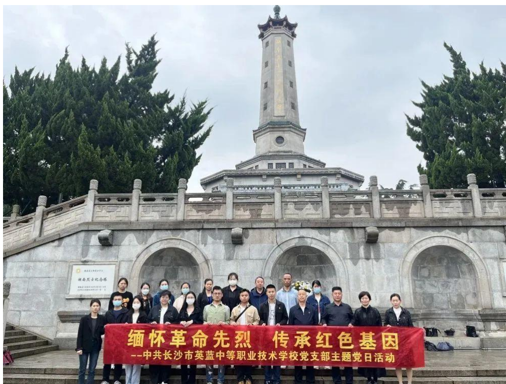
图2 学校党支部前往烈士公园缅怀革命先烈