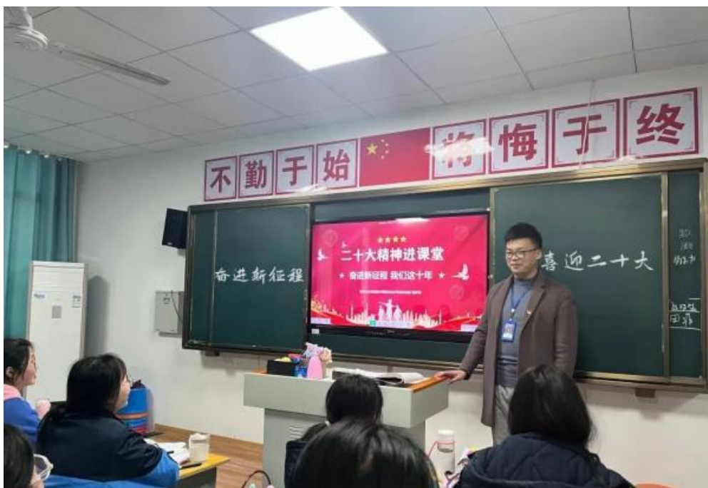
图 39 开展“全体党员进班宣讲二十大精神”活动