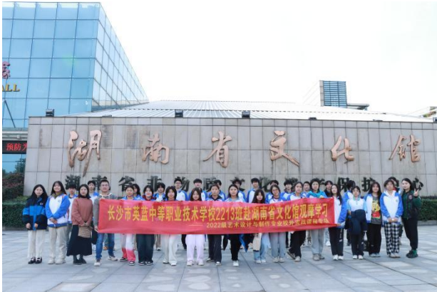
图 13 赴湖南文化馆观摩学习