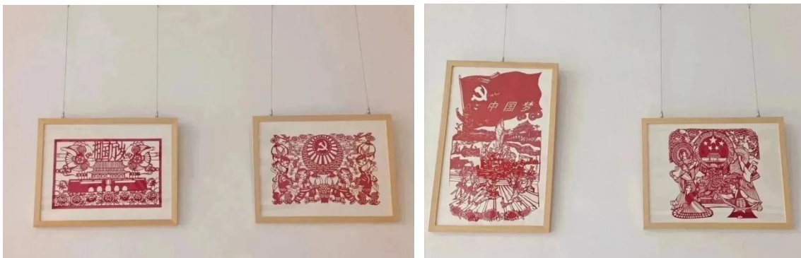
图 60-图 61 剪纸