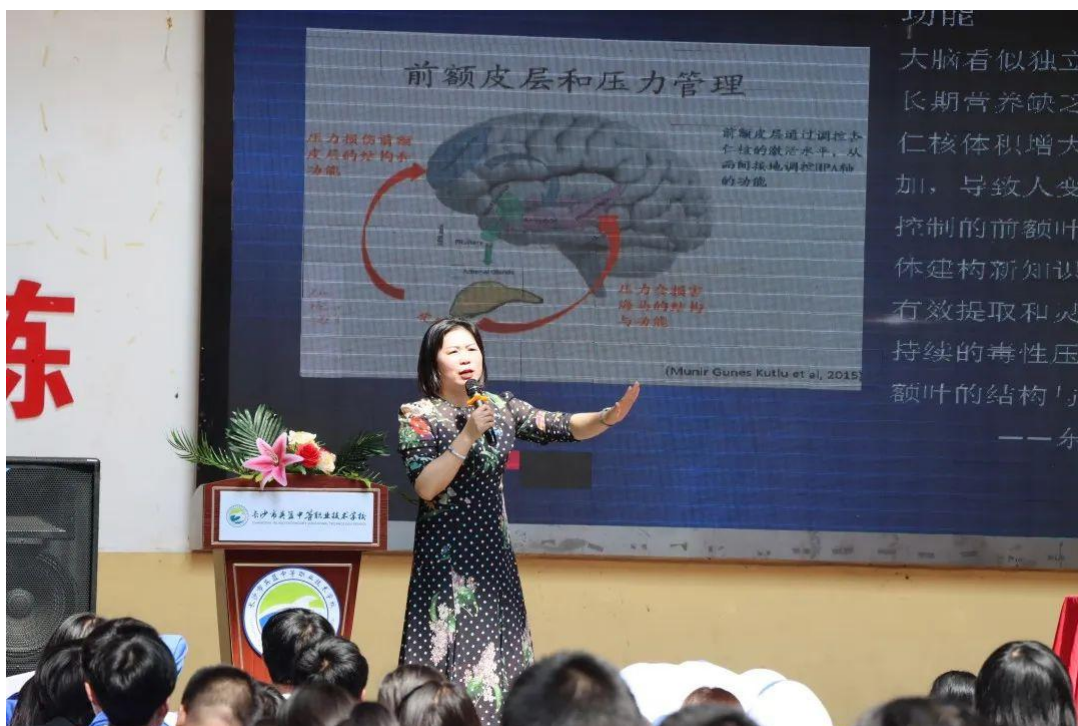
图 12 邀请讲师到校开展心理健康专题讲座

举办心理健康节，学校邀请专家进校开设心理健康讲座，并积极开展心理漫画比赛，举办治愈系心理漫画展览。