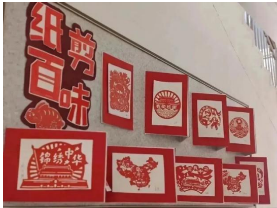
图 46-图 50 “职教生心中的二十大”艺术展览活动