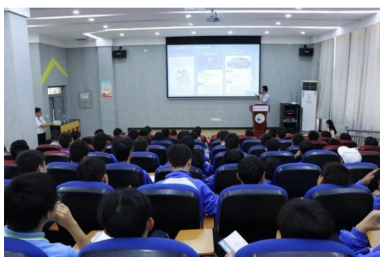
图 29 汽车运用与维修专业知识讲座