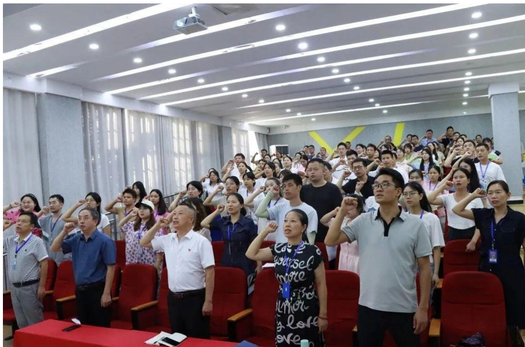
图 25 师德师风警示教育大会