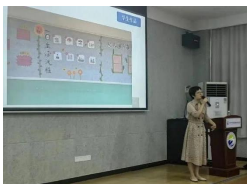
图 28 幼儿保育专业知识讲座