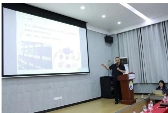
图 27 中药、药剂专业知识讲座