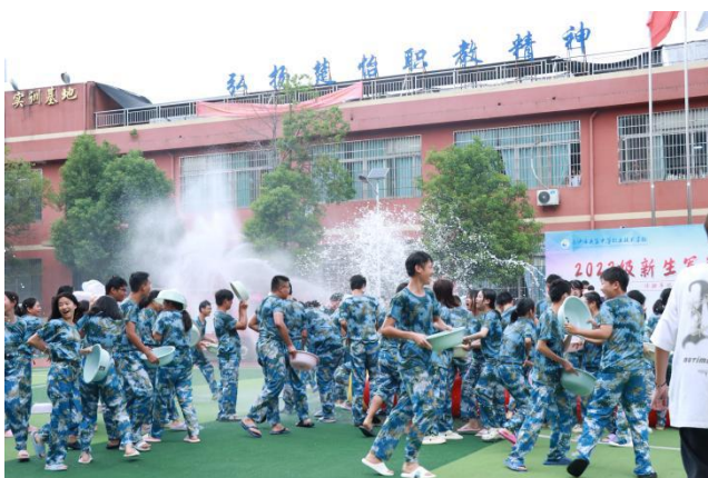
图 19 泼水节

生特点，认真分析学生需求，开展了一系列学生喜闻乐见且富有内涵的校园活动。如歌手大赛、吃西瓜比赛、拔河比赛、泼水大赛、朗诵比赛、漫画比赛、集体观影、心理情景剧表演、学雷锋系列活动、湖南省科学技术馆研学活动、李自健美术馆研学活动、湖南省地质博物馆研学活动、铜官窑研学活动、夜爬岳麓山等。