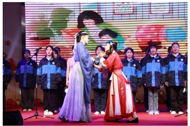
图 18 元旦晚会

学校充分发挥共青团、学生会等学生组织和学生社团贴近同学、覆盖广泛的组织优势，紧密围绕学生，准确把握学