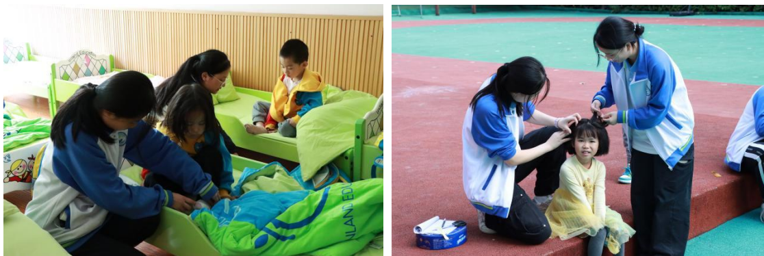
图 51-图 52 幼儿保育专业学生前往幼儿园教学见习

学校注重校企合作，以就业工作为抓手深化产教融合，服务学生，服务企业，体现了学校育人的特色。2023 年，学校先后组织学生前往北京汽车股份有限公司、湖南星昱教育科技有限公司、亿乐艺体文化发展有限公司、雨花区幼幼乐幼儿园、雨花区小博士洞井幼儿园等公司实习、见习，为企业服务。