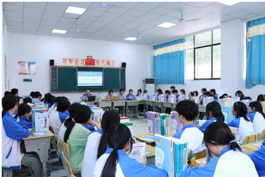
图5 开展“预防校园暴力”法制宣讲讲座

开展禁毒宣传活动。学校通过分发宣传手册、制作宣传栏以及禁毒知识宣传专题讲座等活动形式提高学生识毒、防毒、拒毒能力，以及对毒品的防范与抵御意识。